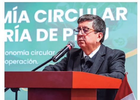
Henry Luna, viceministro de Minas

“Otro proyecto también es Zafranal, en Arequipa, que se viene desarrollando y los inversionistas, quizás, atraídos por los precios internacionales, le están poniendo mayor interés en poder sacarlo adelante. Y también ampliaciones entre ellas la de Anta-